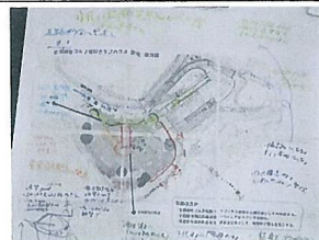
第1回意見交換会 WS結果

各要素の良い所を取り入れ、展望機能と回遊性に加え、ゴルフ場の景観を合わせた植栽や、西口の名所となる魅力を花の名所づくりに特化したプランを作成することとなった。