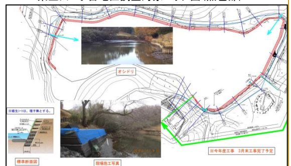
ゴルフ場滝沢池 護岸改修工事対象エリア図